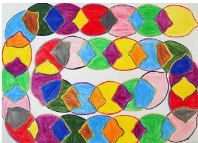
Μαριέτα Ραΐτ Α'2 Γυμνασίου