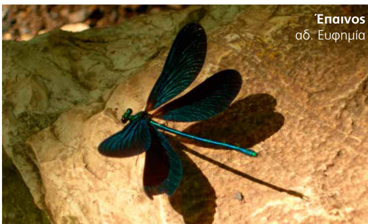
Έπαινος αδ. Ευφημία