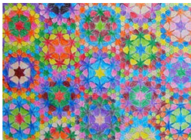
Καραμάνου Βασιλική Α'1 Γυμνασίου