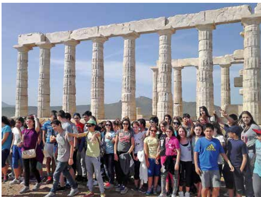
Ναός Ποσειδώνα - Σούνιο

Α' & Β' Γυμνασίου στο Λαγονήσι, την Ανάβυσσο και το Σούνιο