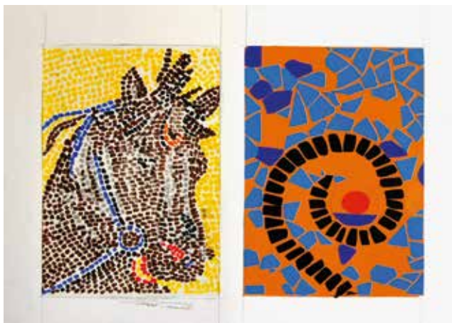
Μαριάμι Χβτσιασβίθι Β'2 Γυμνασίου