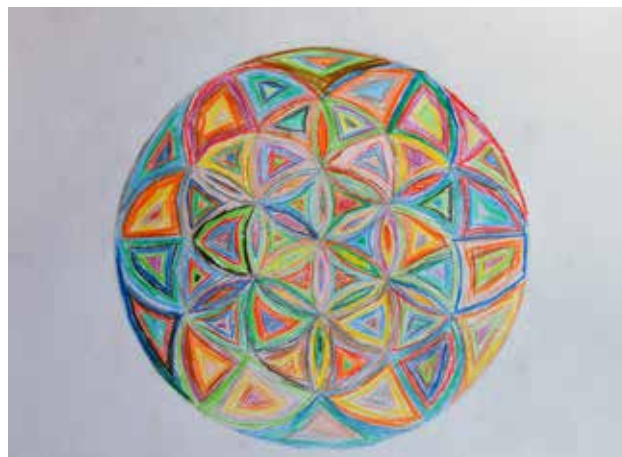
Πετράκης Αντώνης Β'2 Γυμνασίου