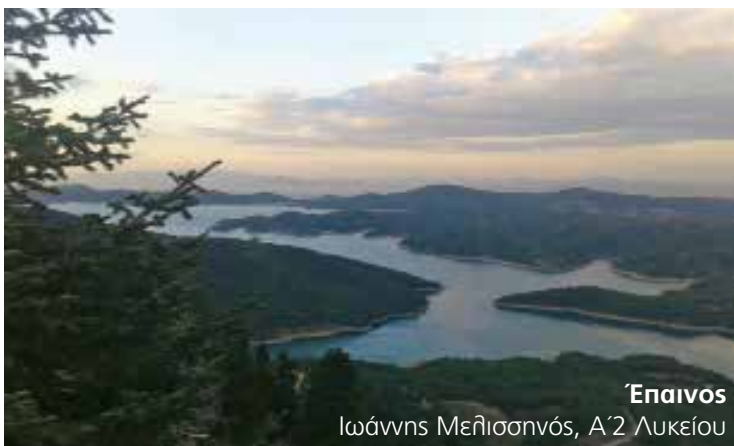
Έπαινος Ιωάννης Μελισσανός, Α'2 Λυκείου

Δημιουργικό - Εκτύπωση: Λυχνία Α.Ε. • τηλ. 210 3410436 www.lyhnia.gr