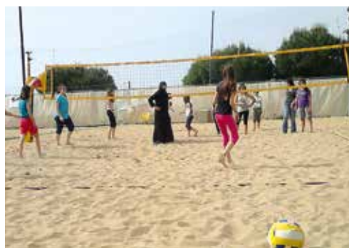
«Anima club», αθλητικό κέντρο στην περιοχή της Αναβύσου.