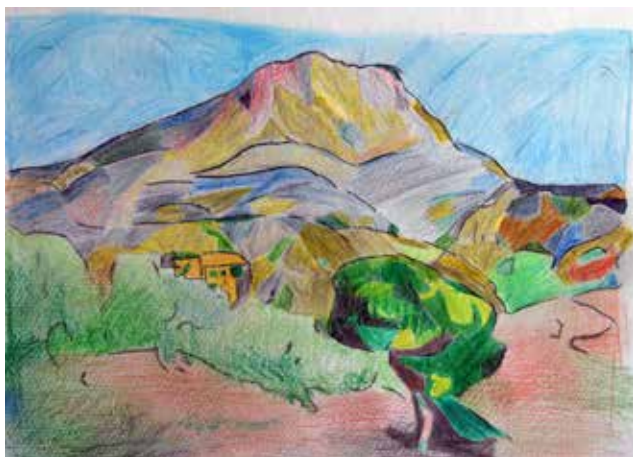
Νικήτας Παναγιωτόπουλος Β'2 Γυμνασίου