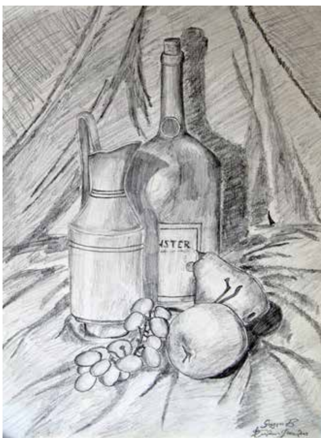
Γιώργος Καλαντζόπουλος Γ'1 Γυμνασίου