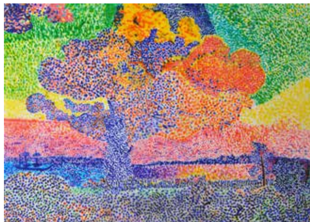
Ζυγοθήνη Μαρία Α'1 Γυμνασίου