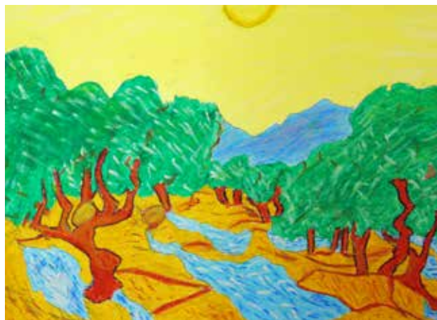
Αυγή Ντάγια Γ'2 Γυμνασίου