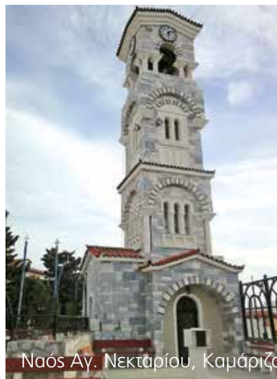
Ναός Αγ. Νεκταρίου, Καμάριζα