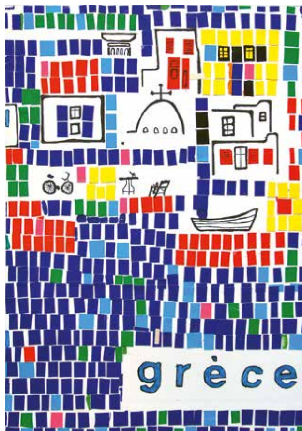
Αλέξης Κονδούλης Γ'1 Γυμνασίου